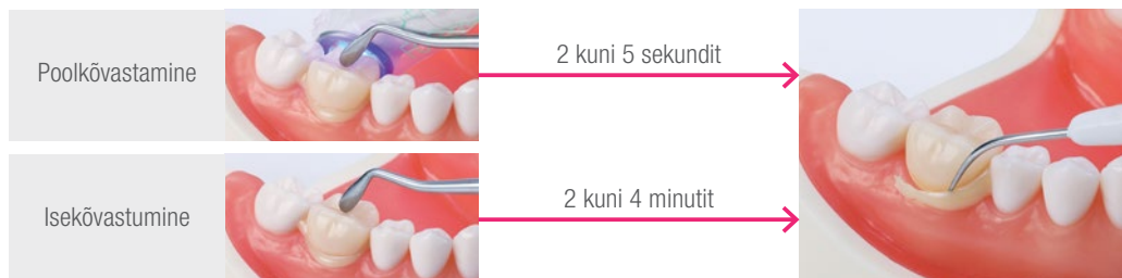
Tsemendi kasutamisel koos CLEARFIL™ Universal Bond Quickiga eemaldate tsemendijäägid kiiremini (1 kuni 2 sekundit).

Polümeerisatsiooni kaks võimalust, lihtne puhastamine, sama tulemus.