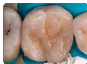
Viimane kiht Essentiaga (Universal värvitoon)