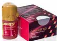
G-Premio BOND Universaalne sidusaine