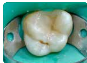
Viimane kiht G-aenial Universal Injectable'iga (A3 värvitoon)