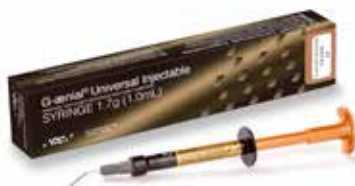
G-aenial Universal Injectable Ülitugev süstitav restauratiivmaterjal