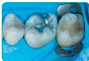
Autor Dr Javier Tapia Guadix, Hispaania

Tänu optimaalsele tiksotroopsusele kohandub everX Flow lihtsalt iga preparaatsiooniga ja aitab vältida poorsuse teket . Materjali kontrollitud voolavus võimaldab ühtlasi seda kasutada ka ülemiste molaaride puhul, ilma et see ära voolaks